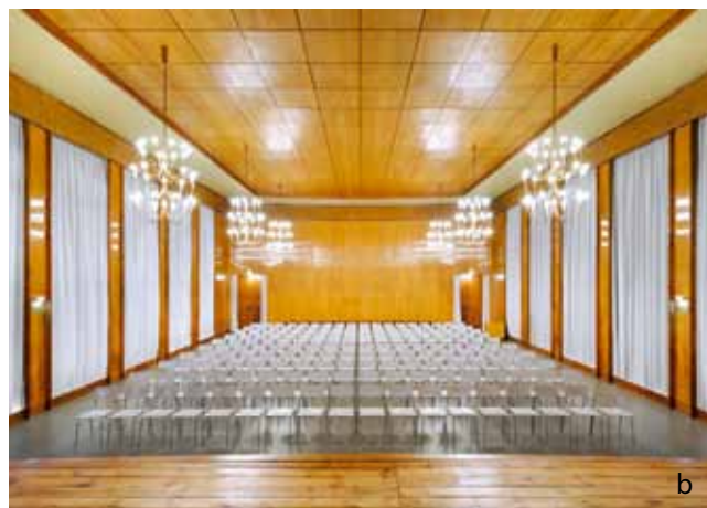
8. Aula škole u vrijeme izgradnje 1956., arhiv Kunsthochschule Weissensee, Berlin (a); aula nakon renoviranja 2012., foto: Philip Lohhoefener, „Bauwelt”, Berlin (b)

The lobby of the school while being built in 1956, archive of the Kunsthochschule Weissensee, Berlin (a); the lobby after the 2012 renovation, photo: Philip Lohhoefener, „Bauwelt”, Berlin (b)