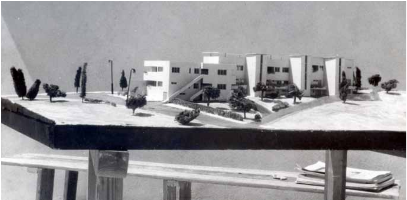
4. Model kuće za više obitelji u Jeruzalemu 1937. Model of a house for more than one Jerusalem family in 1937

ranijeg afiniteta prema predavanjima Kandinskog i Kleea, Selmanagićev funkcionalizam nije u konačnici bio jednostran, utilitaristički program, već prije metoda koja je upućivala upravo na ključnu funkciju sinestetičkih doživljajnih elemenata pri percepciji i oblikovanju. Na temelju predavanja profesora Dürckheima i njegova učenja o „doživljenom prostoru”, Selmanagić je trajno usvojio značaj činjenice o jedinstvu naših doživljaja u percepciji određenog prostora i značaj primjene tog iskustva u budućim projektima planiranja i oblikovanja. 27