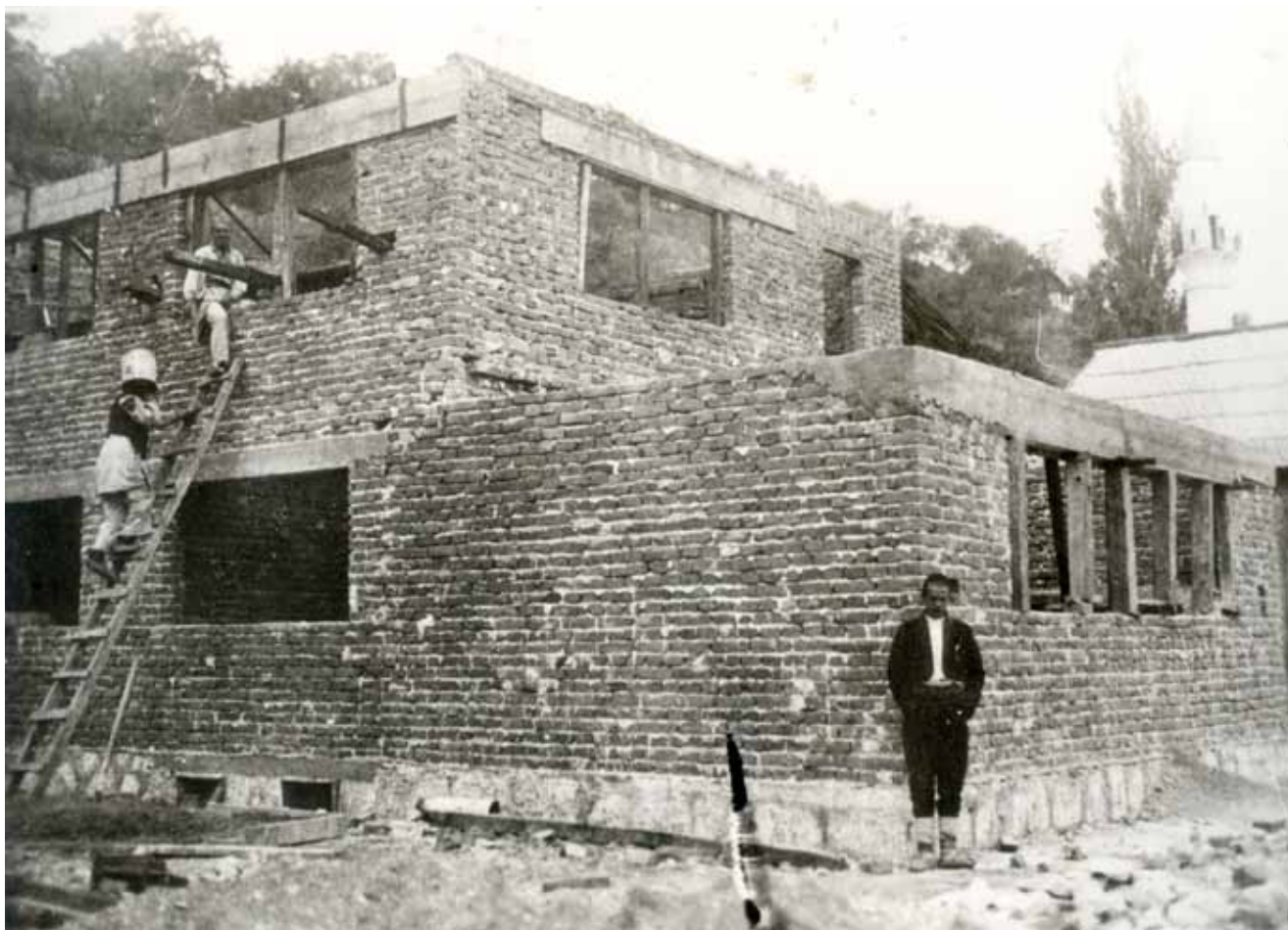
3. Obiteljska kuća u Zvorniku u izgradnji koja je trebala biti dokaz ocu o stečenim znanjima i vještinama kako bi mu nastavio plaćati školovanje

ekonomije. 25 To je potaknulo studente komunističke orijentacije na detaljnije izučavanje ovih pitanja koja će praktično usavršavati nešto kasnije, na seminaru Urbanizam kod profesora Hilberseimera, a u okviru aktivnosti tzv. Studentskog kolektiva . Prema svjedočenju samog Selmanagića, na njega je osobit dojam ostavilo gostovanje češkog predavača Karela Teigea od kojega je usvojio ne samo ustrajavanje na značaju kolektivnog rada u projektima nego i nadilaženje razumijevanja arhitekture kao isključivo „vizualnog fenomena” (Teigeovim riječima: „ protiv diktature oka ”), što je u vrijeme Teigeova gostovanja u Bauhausu koincidiralo s polemikom koju je tih godina ovaj profesor vodio s Le Corbusierom o pitanju uloge i značaja arhitekture. 26 Zahvaljujući široku polju interesa, između ostalog i za predavanja iz psihologije forme kod profesora Karlfrieda Grafa Dürckheima koja je Selmanagić slušao tijekom trećeg, četvrtog i petog semestra, kao i zbog njegova