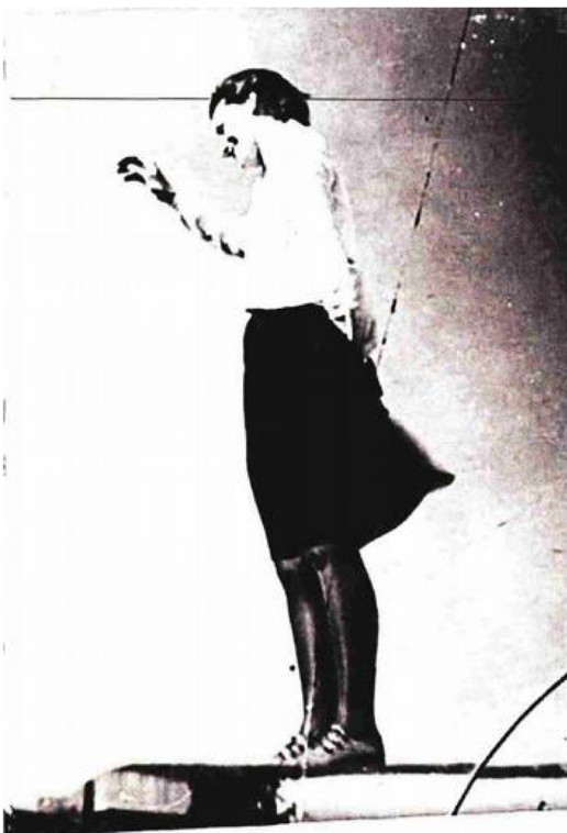
1929 Bauhaus 1929

Bauhaus Networking Ideas and Practice Umrežavanje ideja i prakse