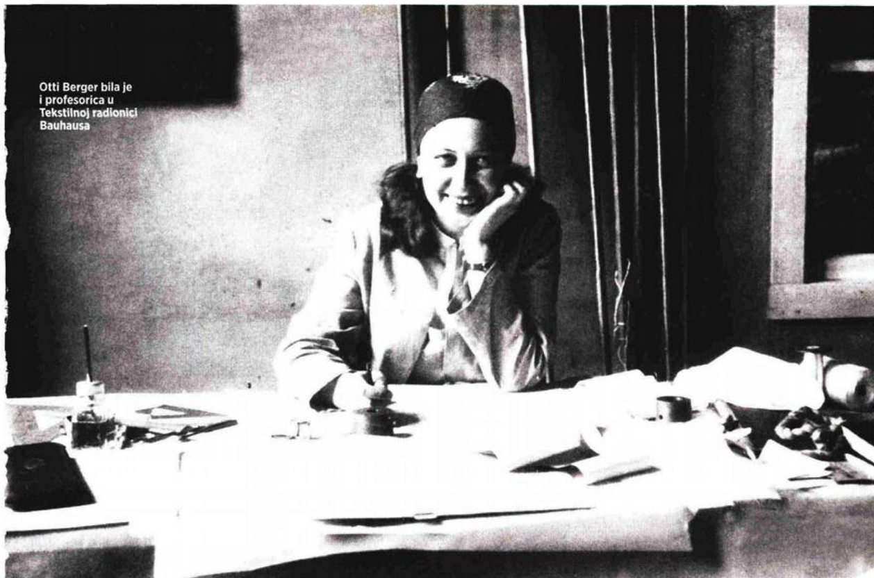
Otti Berger bila je i profesorica u Tekstilnoj radionici Bauhauasa

Bauhaus Networking Ideas and Practice Umrežavanje ideja i prakse